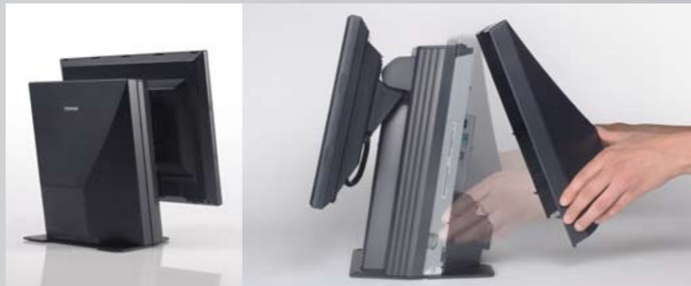
Einfachste Wartung durch Klick-Verschluss

Der preisgekrönte ST-A10 TouchPOS von Toshiba bietet bei minimalem Platzbedarf eine breite Funktionspalette. Benutzerfreundliche Klick Verschlüsse sowohl am Gehäuse als auch bei den Komponenten machen die Wartung zum Kinderspiel. Intelligente ergonomische Funktionen ermöglichen eine Beschleunigung des Bezahlvorgangs an der Kasse.